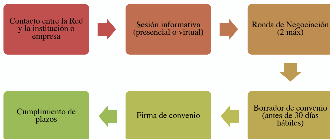
Figura 2. Proceso de formalización